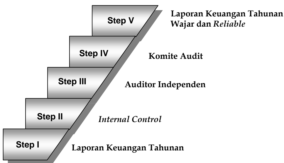
Gambar 1. Kerangka Pemikiran

Menurut pandangan penulis atas kerangka pemikiran di atas, penilaian kecukupan peraturan perlindungan investor pasar modal Indonesia mencakup beberapa komponen analisa yaitu :